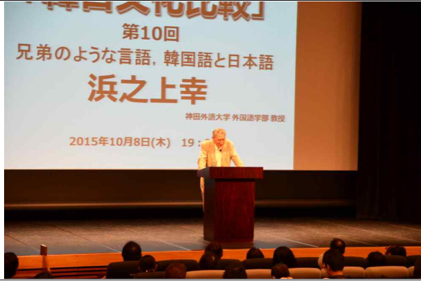
한국문화원 강연회 - 한일문화비교