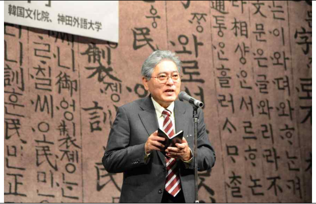
함께 말해보요 한국어 도쿄·일반학생대회